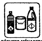
DÉCHETS MÉNAGERS SPÉCIAUX (DMS)