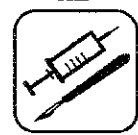
DÉCHETS D'ACTIVITÉS DE SOINS À RISQUES